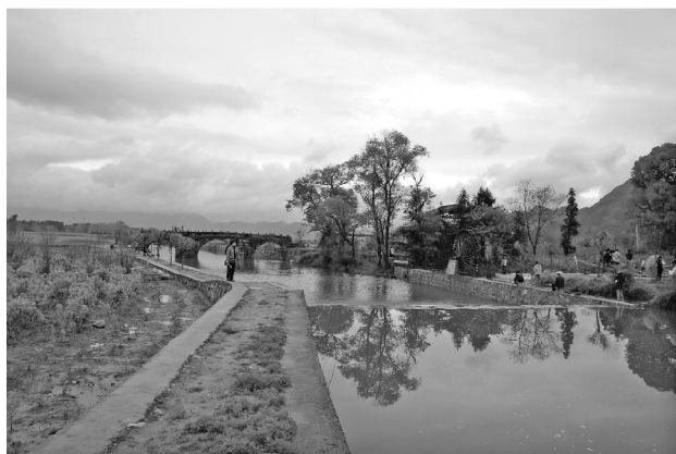
图2 黟县南屏村水口

在徽州，几乎所有古老的村庄的村口，都有着人工刻意营建的痕迹，或一丛树林，或一座石塔，或一幢庙宇，这就是在徽州村落整体建筑格局中有“门户”和“灵魂”之誉的水口。（图2）