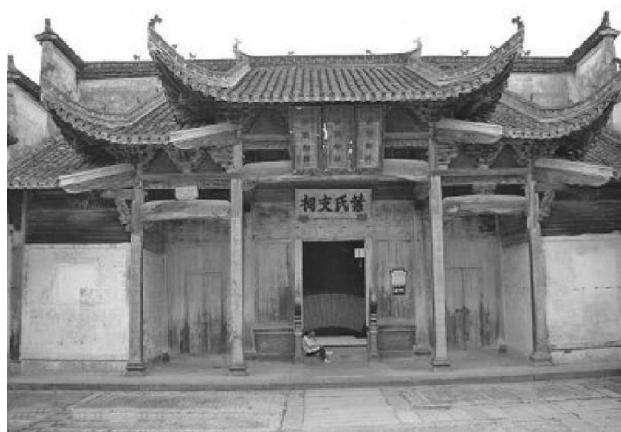
图5 歙县南屏村叶氏支祠

徽州的强宗大族,历来是聚族而居,尤在南宋之后,特别是受了程朱理学思想的重要影响。尊祖敬宗,崇尚孝道便就成了徽州人的重要理念和宗旨。然在宗族下的祠堂则是村落的核心,居首要地位。在乡土社会中宗教的发展与人民的生活需求又总是连在一起的,它是人们信仰的依托,因此祠堂、庙宇是人们趋吉避凶可信赖的保护点。(图5)